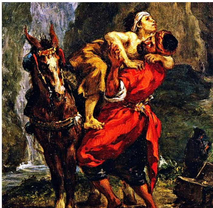
Chrystusa w chorych i ubogich.

Z tej perspektywy uczynki miłosierdzia odzyskują pełnię proroczej mocy : odwiedzanie chorych, pocieszanie strapionych, przyjmowanie samotnych, wspieranie tych, którzy są pozbawieni podstawowych potrzeb. Nie jest to pobożna lista, lecz prawdziwa mapa Ewangelii w rękach chrześcijan, którzy odnajdują oblicze