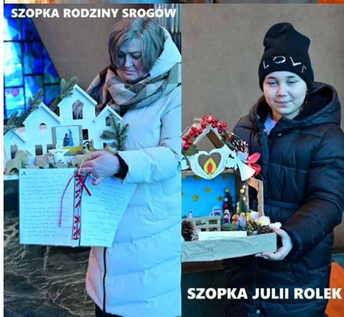
SZOPKA RODZINY SROGÓW