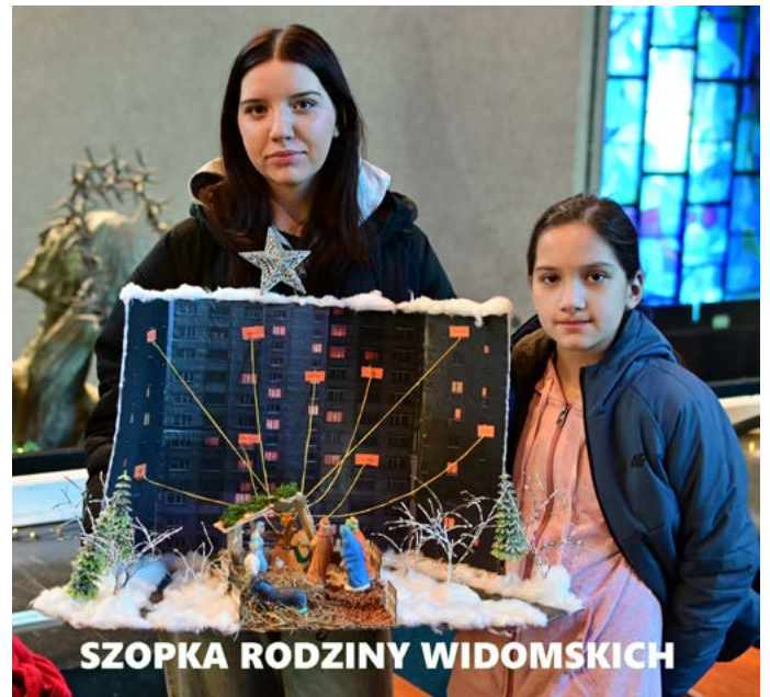
SZOPKA RODZINY WIDOMSKICH