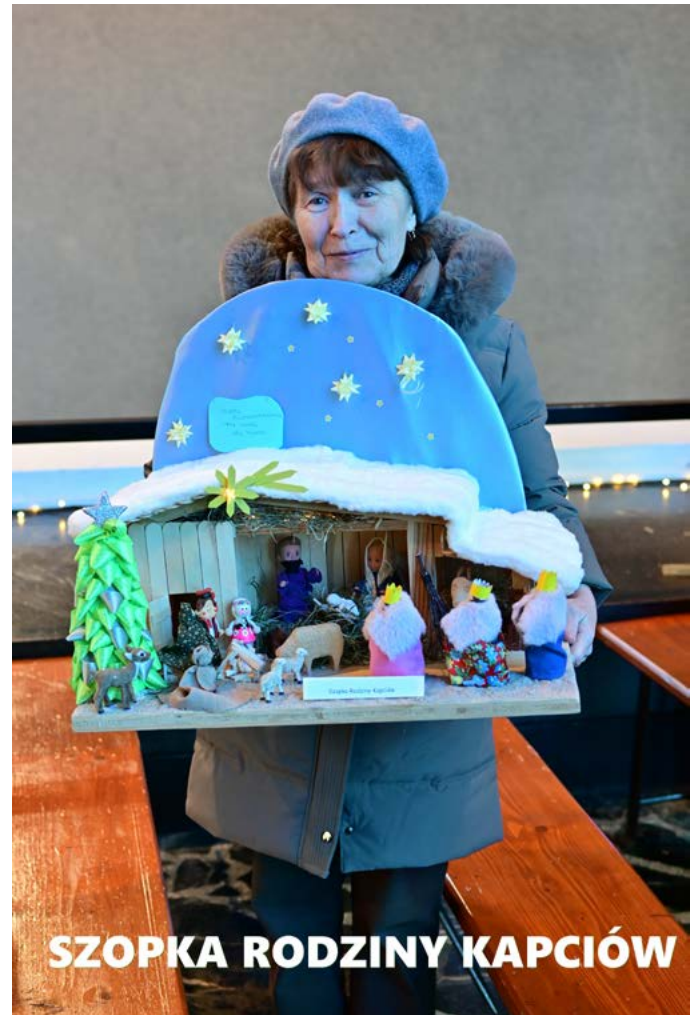
SZOPKA RODZINY KAPCIÓW