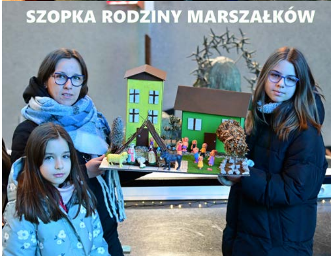
SZOPKA RODZINY MARSZAŁKÓW