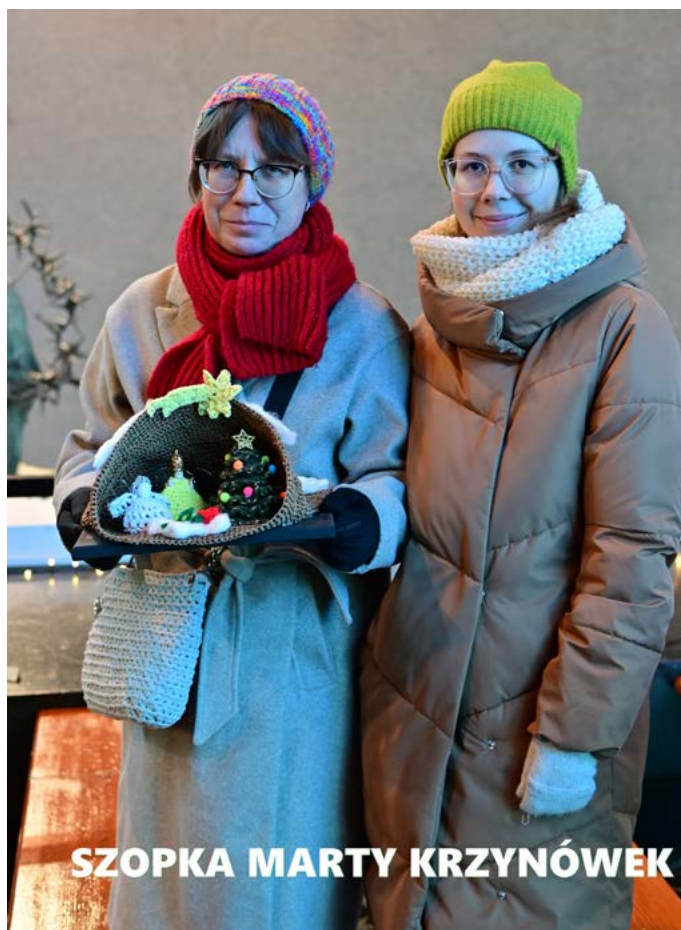
SZOPKA MARTY KRZYNÓWEK