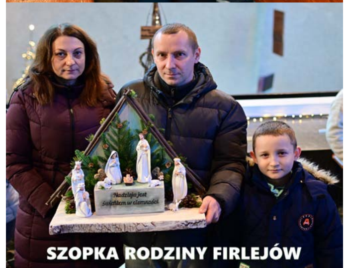
SZOPKA RODZINY FIRLEJÓW