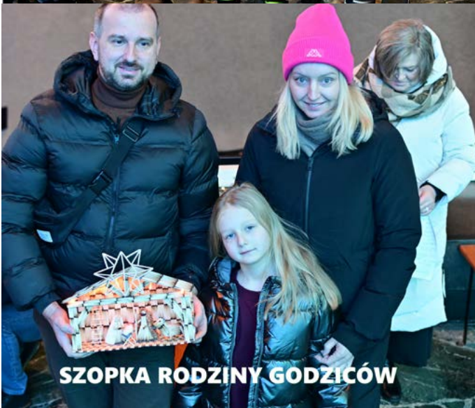
SZOPKA RODZINY GODZICÓW