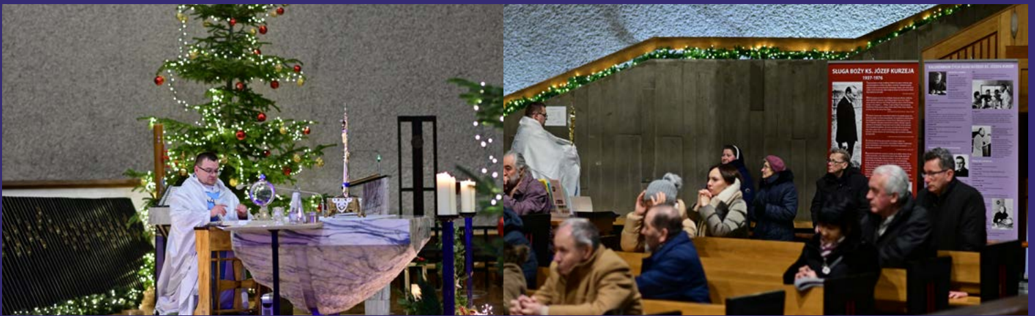
04.01.2026 - MĘSKI RÓŻANIEC