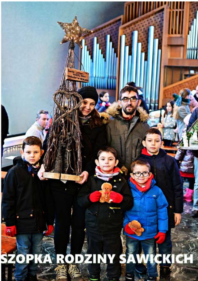
SZOPKA RODZINY SAWICKICH