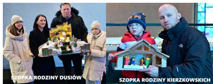
SZOPKA RODZINY DUSIÓW