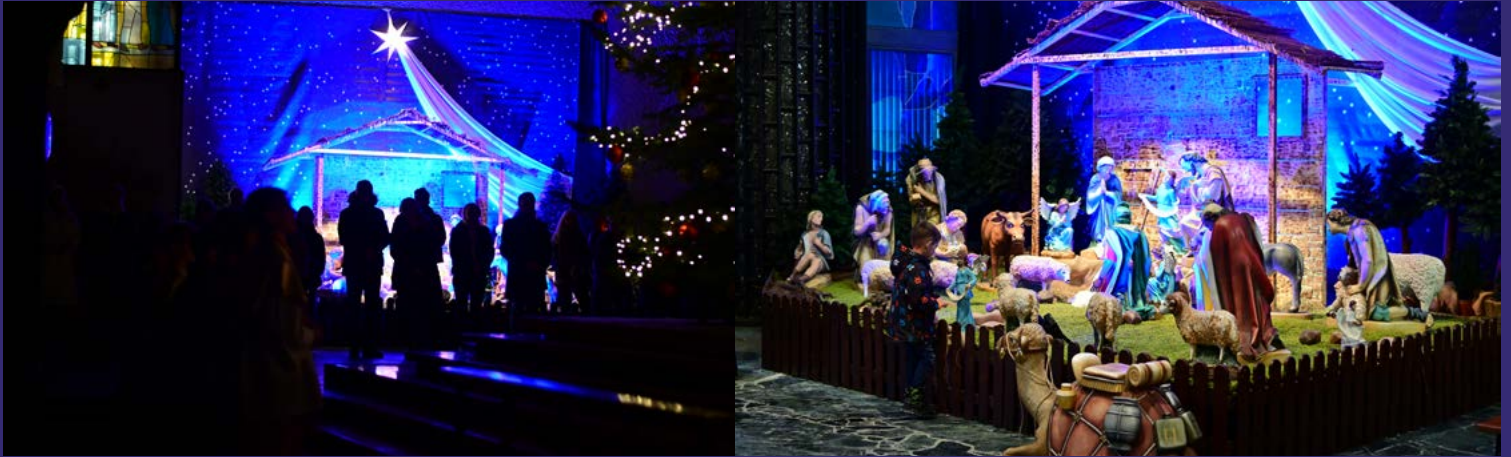
03.01.2026 - WIECZÓR ZAWIERZENIA